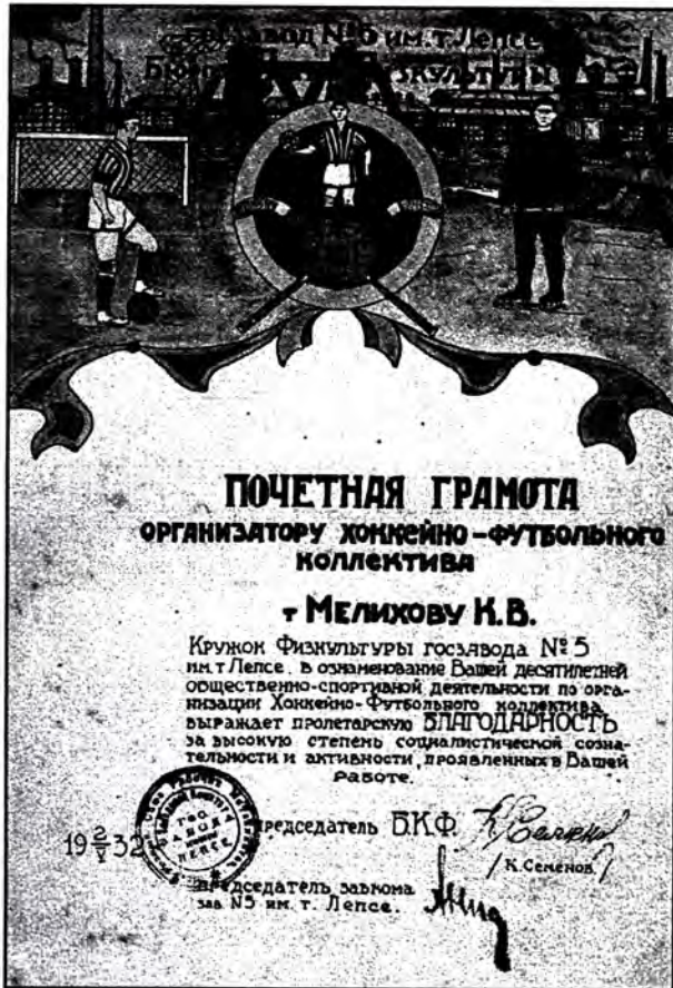
Почетная грамота. 1932 г.

завод н. 5 имени Лепсе, где до начала Отечественной войны был бессменным председателем футбольно-хоккейной секции.