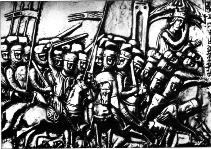
Армия немецких рыцарей в полном вооружении, XIII в. Шкатулка из кафедрального собора в Дакхене (Германия)

что походами 1240 и 1242 года западные соседи «отблагодарили» Русь «за ее безмерную жертву, принесенную в защиту западного мира, безрассудным использованием татарского бедствия для завоевания Северо-Западной Руси».