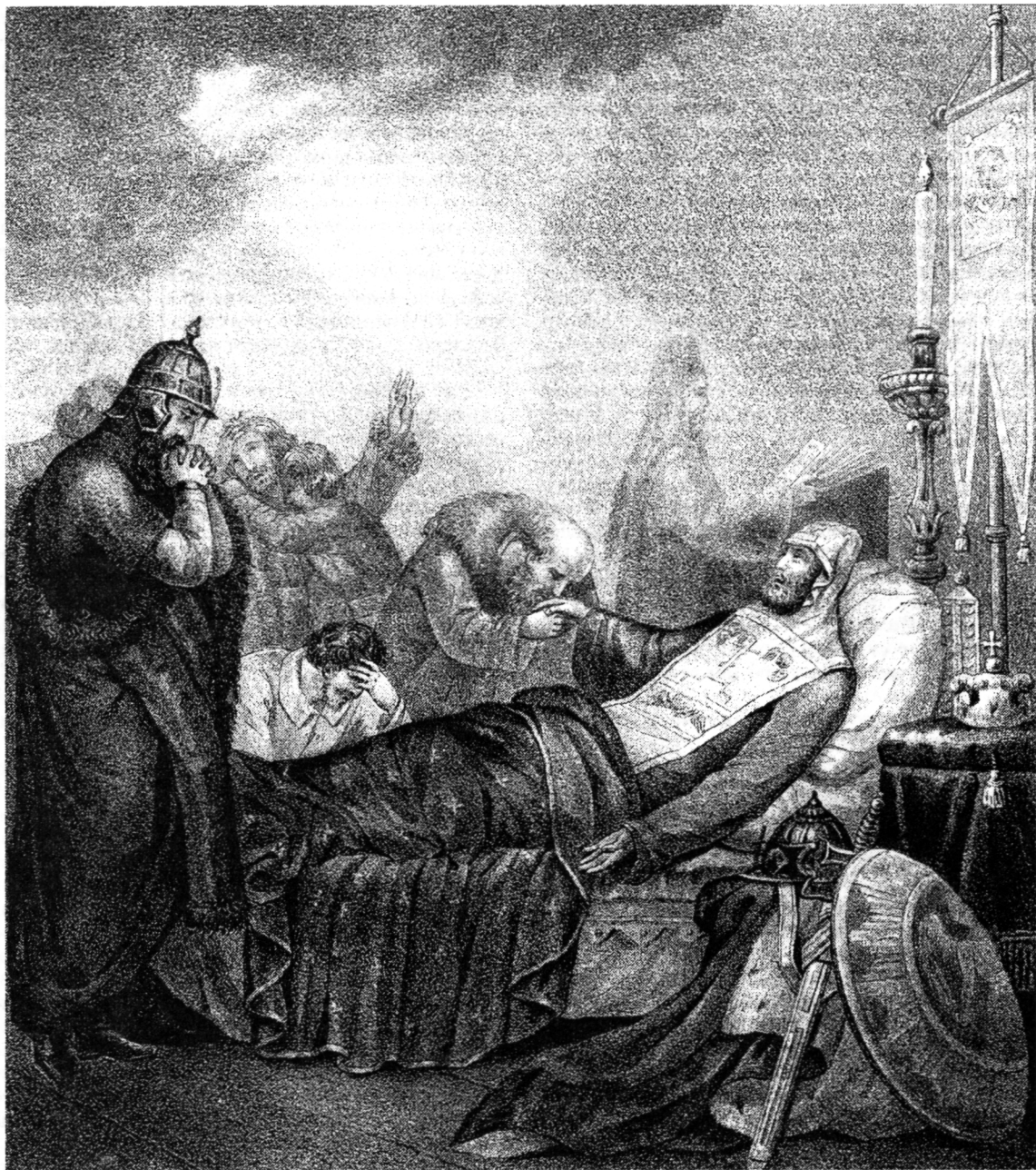
Александр Невский принимает схиму.