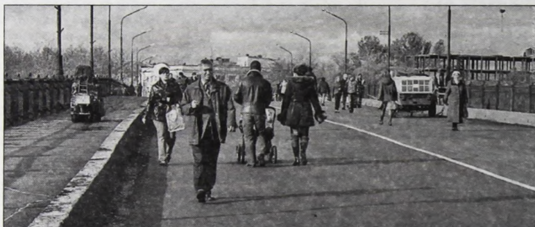
Ремонт моста этой осенью дал новгородцам редкий шанс погулять по проезжей части

Елена КУЗЬМИНА Владимир МАЛЫГИН