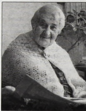
Людмила Ефанова — главный архитектор Великого Новгорода в 1950—1957 гг.

— Тогда это был рывок вперёд. Мост стал архитектурной доминантой города. Не он подстраивался под окружающую среду, а строившиеся здания равнялись на него! Можно сказать, что появление большого моста в Новгороде стало одним из толчков для развития областного центра,