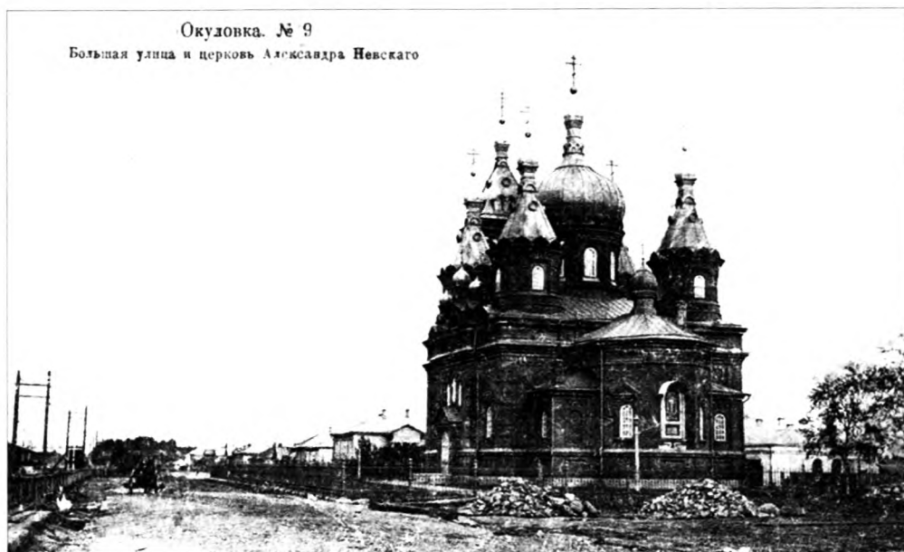
Церковь Александра Невского на ст. Окуловка. Начало XX в.

помещения, из которых одно с особым входом служило пономарней, а другое предназначалось для ризницы. В церкви имелось амосовское (подвальное) отопление. Она была рассчитана на 3 тысячи человек и при хозяйственном способе постройки обошлась приблизительно в 80 тысяч рублей. Её величественное здание обогатило силуэт Окуловки и задало новый вектор в застройке станции.