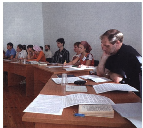
Участники «Юрьевского городка» 2011 г.