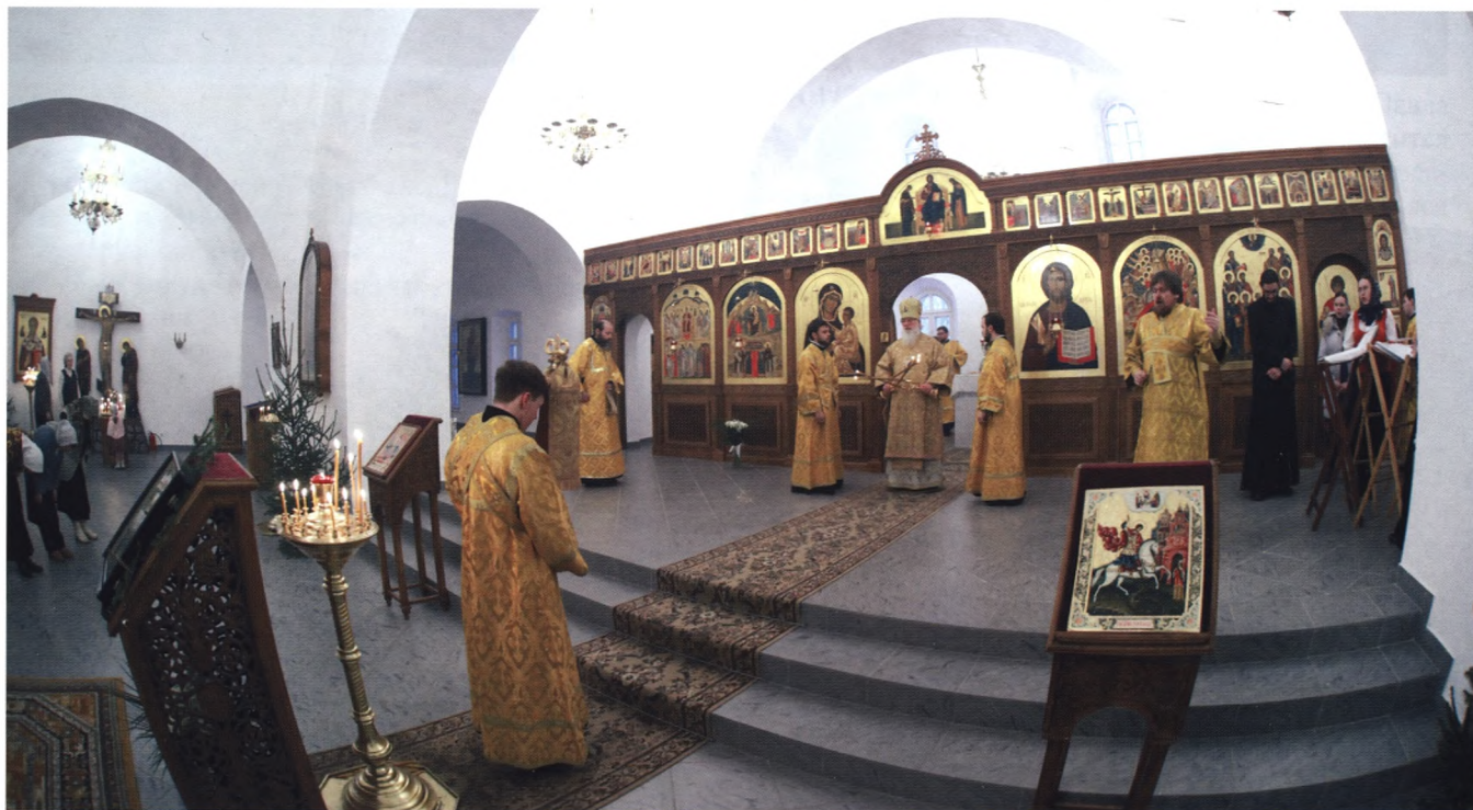
Богослужение в домовом храме Новгородского Духовного училища

С благословения Святейшего Патриарха Алексия II и решением Священного Синода от 14 сентября 2004 г. в Юрьевом монастыре было открыто Новгородское Духовное училище. Базой для учебного процесса послужила монастырская библиотека, которая пополнилась новой учебной литературой, и сейчас в ней насчитывается 13 000 экз. книг. В 2005 г. училище переехало из Орловского в Северный корпус. Открылся экстернат – заочная форма обучения для священнослужителей. А в 2006–2007 учебном году училище разместилось в восстановленном Архимандритском корпусе. Здесь находится пять учебных классов, музыкальный класс, кабинет церковного искусства, компьютерный класс, актовый зал и трапезная. В 2007 г. состоялись первые рукоположения воспитанников Новгородского Духовного училища. В 2008 г. на Рождество Христово был освящён относящийся к училищу Рождественский (Спасский) собор. Материальная база Новгородского Духовного училища комиссией Московской Патриархии признана одной из лучших среди такого же класса духовных училищ. Лучшие студенты продолжают свое образование в Петербургской духовной семинарии и Академии и по завершении возвращаются для пастырского служения и преподавания в Новгородском духовном училище.