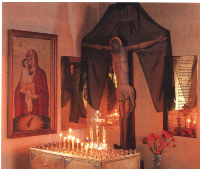
Памятные мемориальные доски

При школе действуют театральная студия и патристический клуб, летом организуется детский православный лагерь. 7 октября 2012 г. по благословию митрополита Льва в воскресной школе состоялся семинар