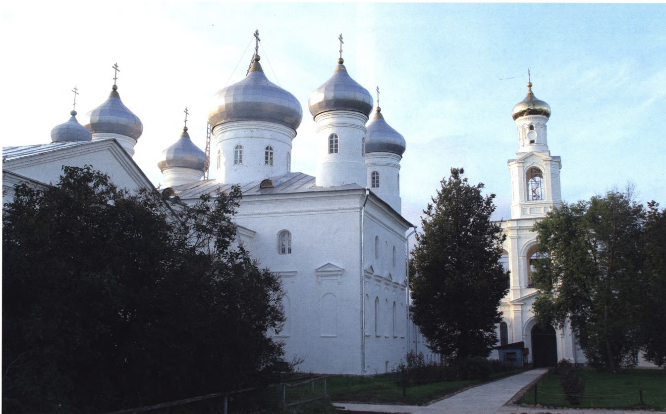
Рождественский (Спасский) собор

Дореволюционная история Юрьева монастыря как центра русской святости связана более с благоверными