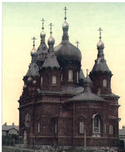
Фото начала XX в.

По сохранившимся описаниям «каменная церковь имела длину с колокольней 18 сажень. На церкви был купол каменный, осмерик и четыре малых по углам, на всех железные кресты с золочеными шарами. Колокольня была трехъярусная, высотой 12 сажень. Внутри церковь была оштукатурена и расписана орнаментом по сводам и стенам». В 1908 году рядом с церковью по благословению св. Иоанна Кронштадтского была построена богадельня, на открытие которой он прислал свой портрет с дарственной надписью.