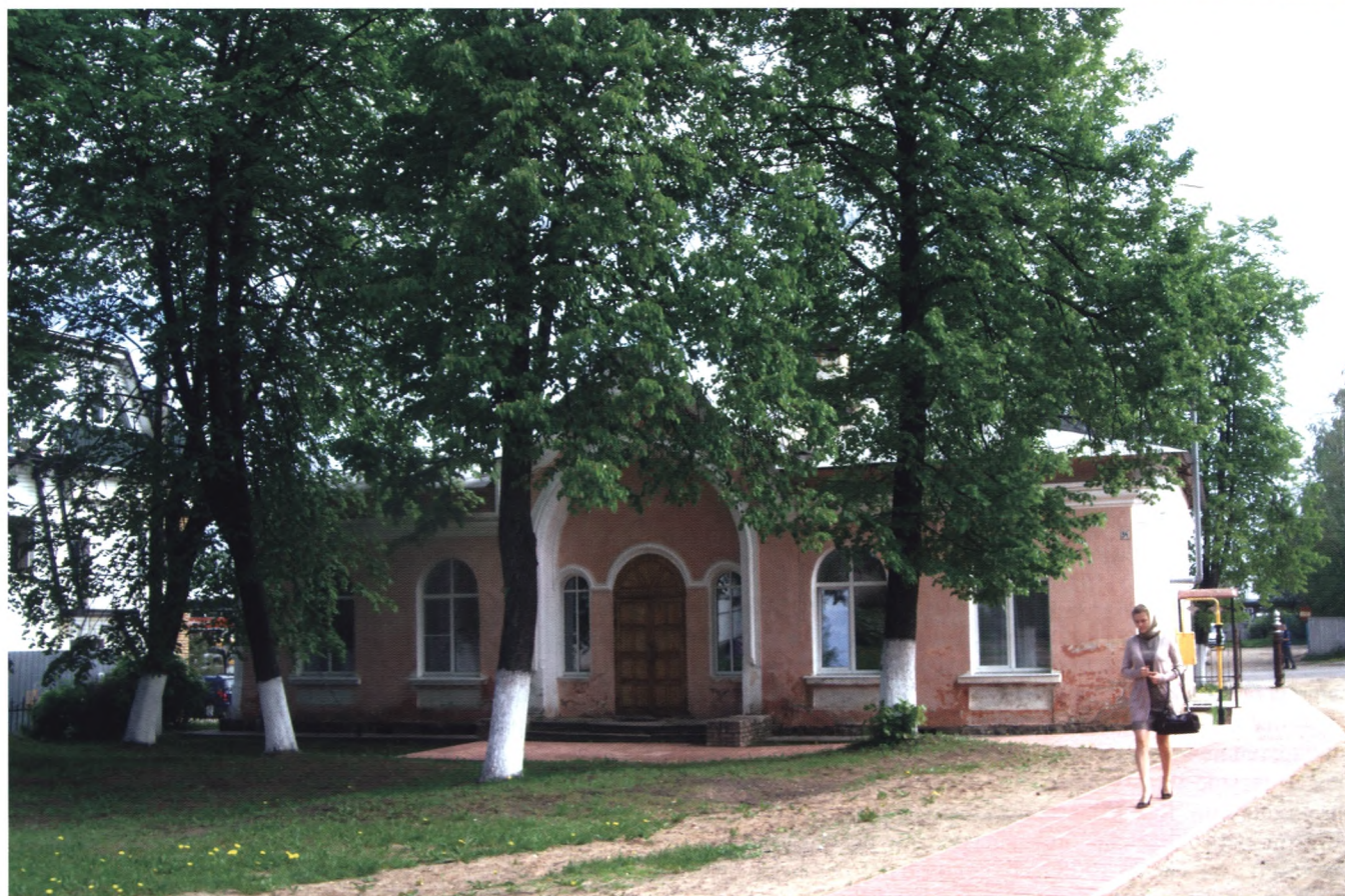
Здание воскресной школы