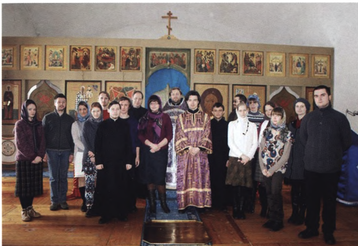
Участники «Литургических суток»