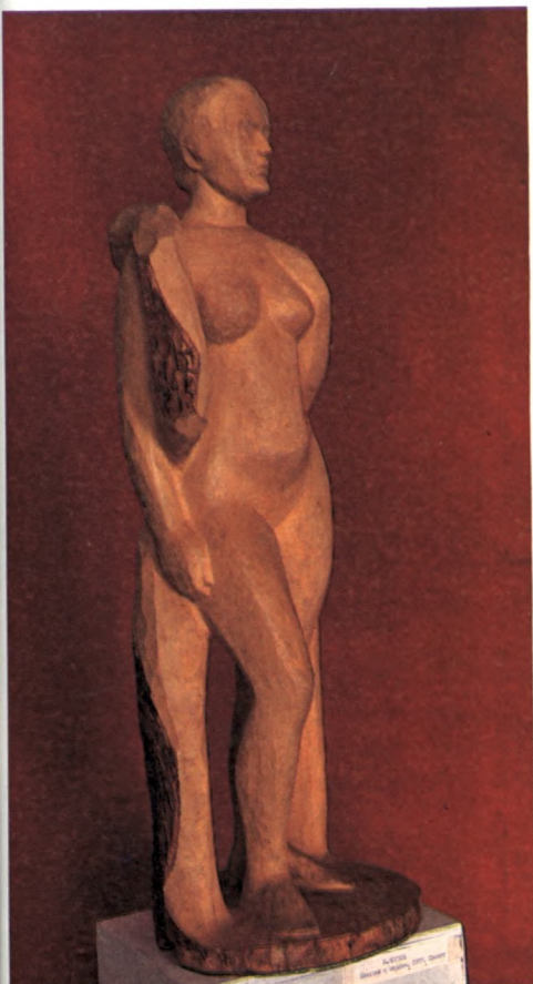
164 Интерьер мастерской Ю. Чернова 165 Девушка с шарфом 1983