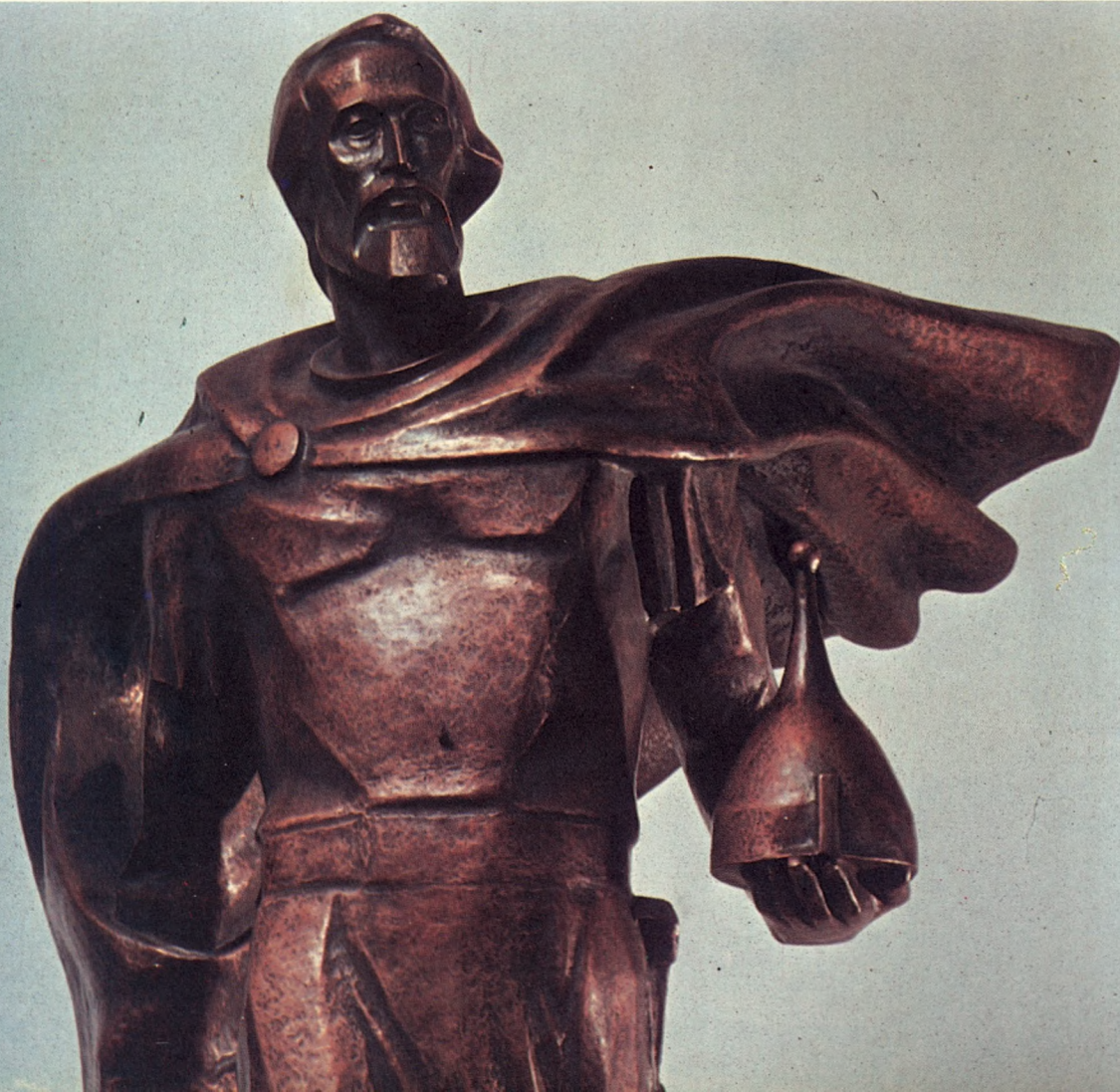
133 Александр Невский 1980 Фрагмент