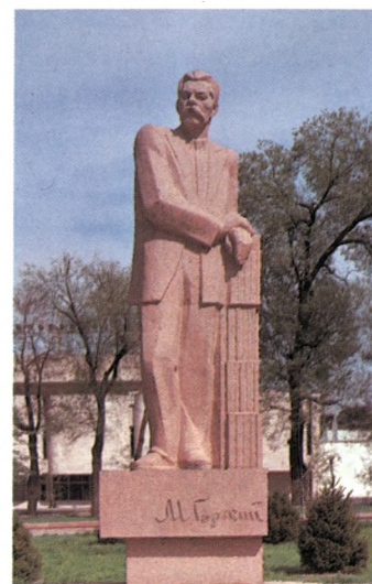
Памятник Максиму Горькому. 1981 Гранит. Высота 400 Архитектор Г. Г. Исакович Фрунзе