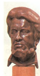
Итальянский путешественник Карло Маури 1982 Кованая медь 42 × 19 × 21 Министерство культуры РСФСР. Москва