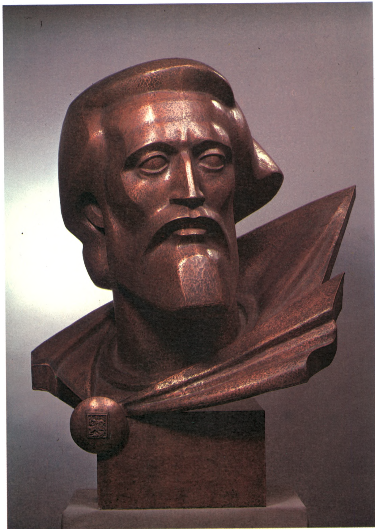
166 Александр Невский 1983