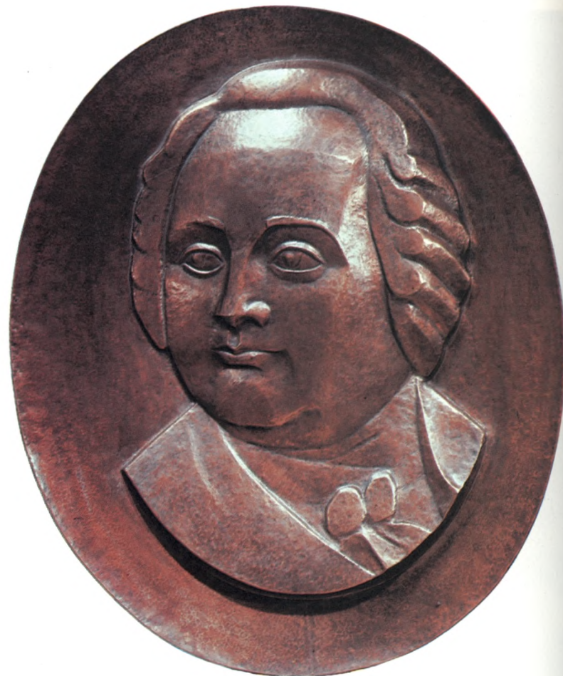
134 Александр Невский 1980