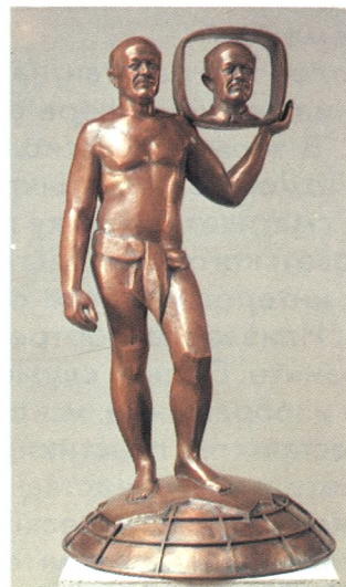
Ю. А. Сенкевич. 1983 Кованая медь 80 × 35 × 35

Большие изменения в направлении архитектурной упорядоченности, композиционного единства и даже образного характера персонажей претерпела композиция 1981 года «Время беседы», второй вариант которой скульптор назвал «Время идет». Это групповой портрет друзей художника вместе с его автопортретом, построенный очень необычно. Некоторая замысловатость композиции вызывает вопрос, который с учетом обоих вариантов названия можно было бы сформулировать так: когда же мы начнем свою беседу? Таким образом, здесь в близкой автору манере парадокса поставлена актуальная проблема человеческого общения, подлин-