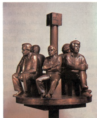
Время идет. 1983 Кованая медь 210 × 80 × 80 Союз художников РСФСР. Москва