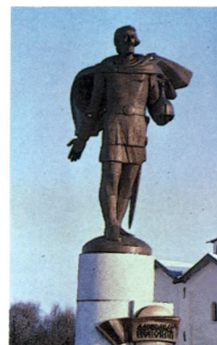
Памятник Александру Невскому. 1985 Архитектор Г. Г. Исакович Бронза. Высота 650 Новгород Фрагмент

В памятнике Чернов использует тот же композиционный мотив, но в другом осмыслении, несущем и биографическую, и социально-историческую, и творческую символику: Шадр как бы вырубает свою фигуру из глыбы красного гранита. Однако фигурой не исчерпывается этот уникальный мемориал, созданный Черновым и его почти постоянным соавтором, архитектором Г. Исаковичем.