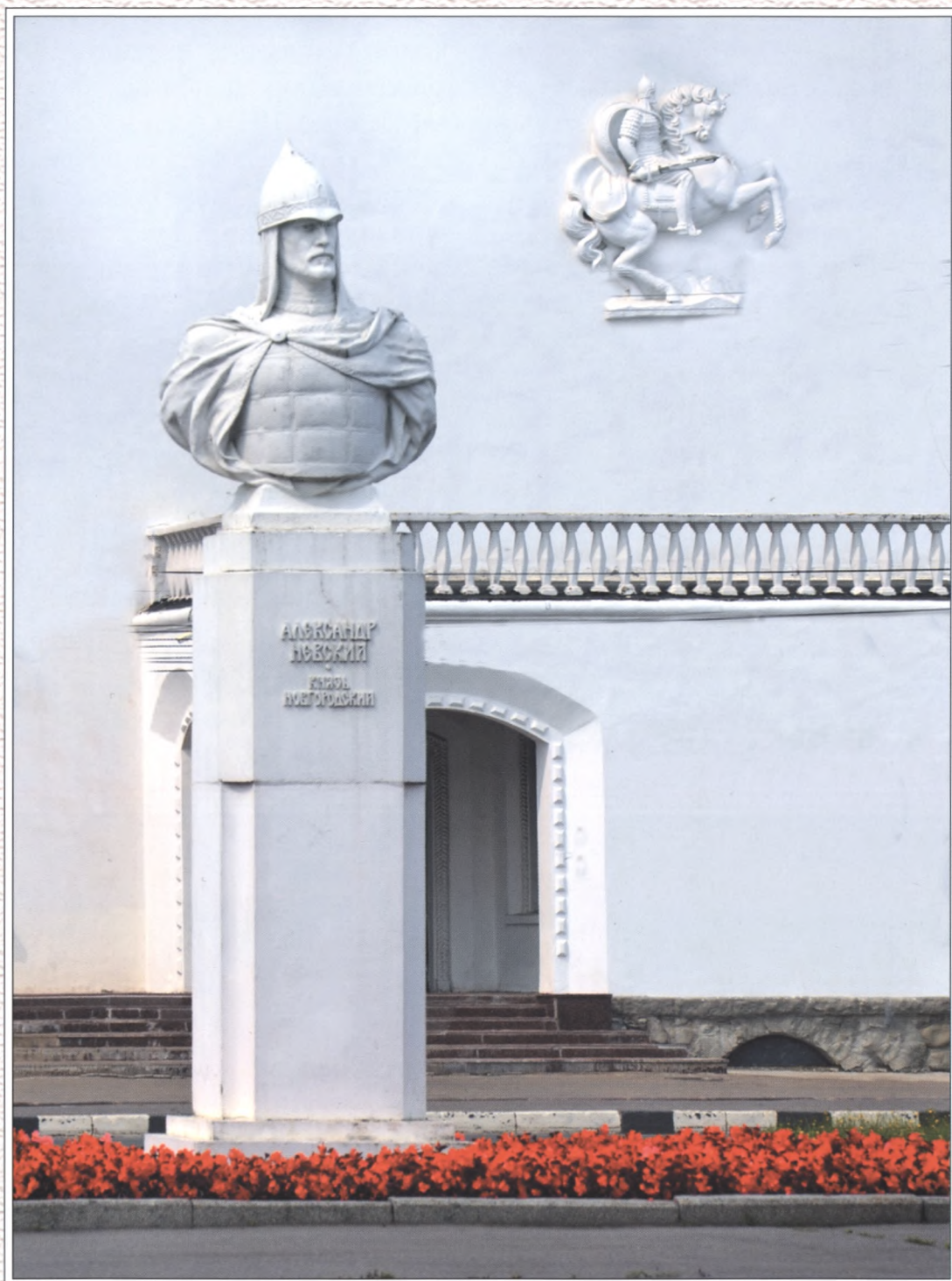
Скульптор З. Азгур. 1959 год. Переустановлен в 1995 году

В 1959 году в Новгороде был открыт бюст Александра Невского. Памятник первоначально располагался в древней части Новгорода. В 1995 году его перенесли на привокзальную площадь и установили на месте памятника К. Марксу, который был демонтирован. На постаменте к словам «Александр Невский», высеченным в советское время, добавили «Князь Новгородский».