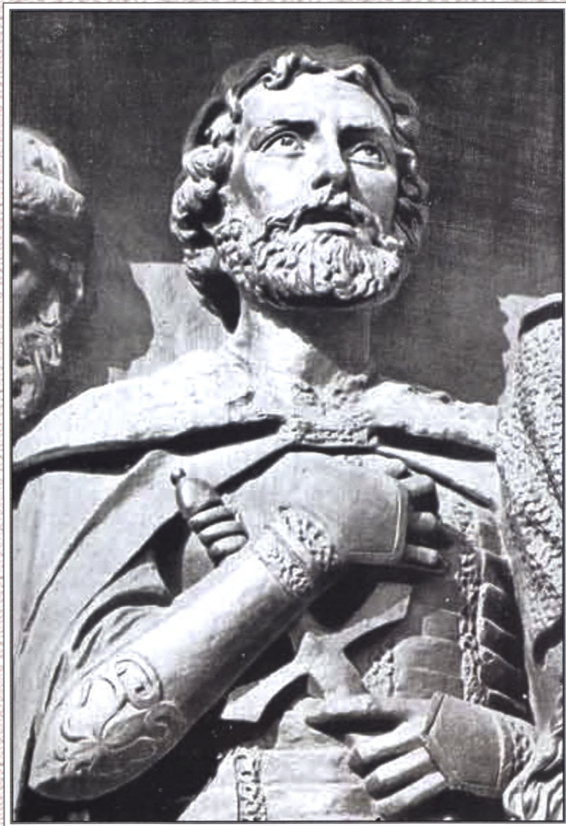
Александр Невский. Памятник «Тысячелетие России»

Всего на памятнике помещено 129 фигур, среди которых есть и Александр Невский. Правда, он не вошел в число самых видных исторических личностей, которые были помещены в верхней части памятника, таких как Петр I, Дмитрий Донской, Минин, Пожарский и другие.