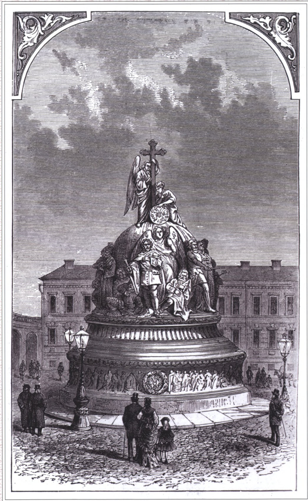
Памятник «Тысячелетие России» в Великом Новгороде. 1862 год