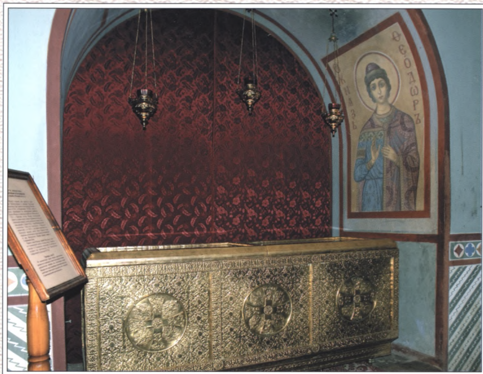
Рака с мощами Феодора Новгородского

Благоверный князь Феодор Новгородский, старший брат Александра Невского, родился в 1218 году. Княжеское служение его началось в раннем возрасте; уже в 1229 году оба брата были оставлены в Новгороде их отцом Ярославом Всеволодовичем как представители его власти. Не прошло и года, как юным княжичам пришлось покинуть Новгород: буйные новгородцы постановили на вече призвать другого князя. В 1230 году во время голода и мора новгородцы снова пригласили Ярослава. 30 декабря 1230 года он в четвертый раз сел на княжение в Новгороде, но сам пробыл в городе лишь две недели, вновь посадил там своих сыновей и ушел в Переславль-Залесский.